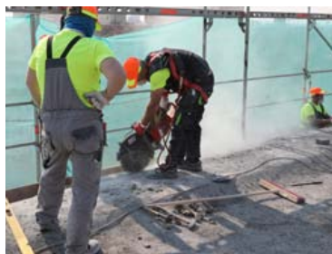
Vanade karniisipaneelide mahalõikamine.