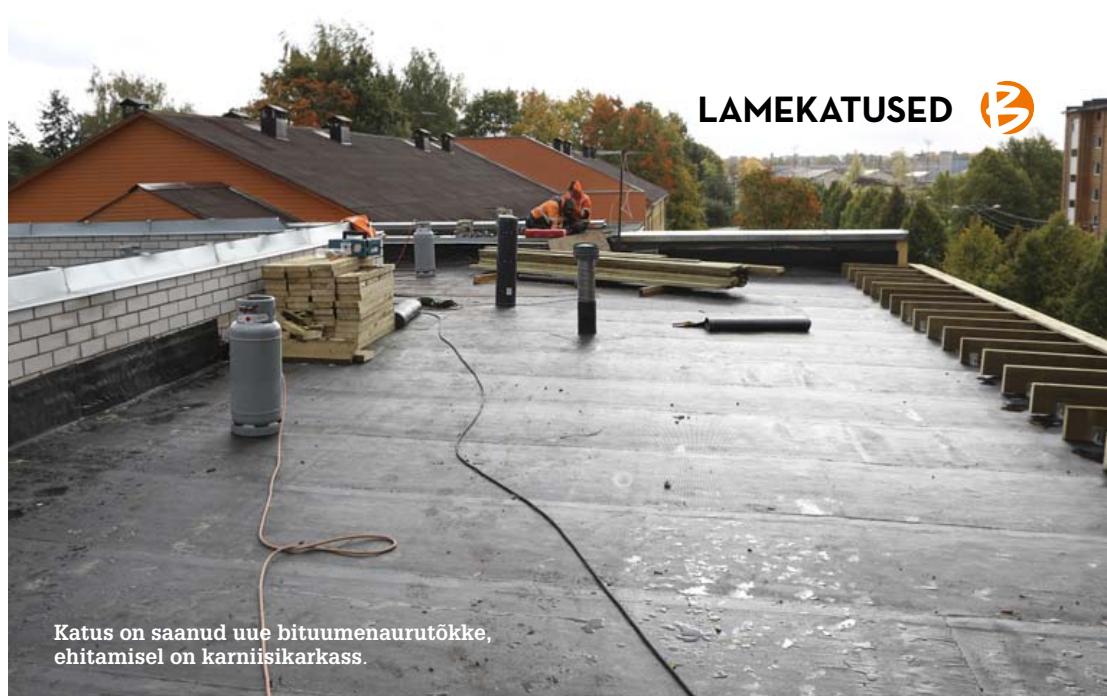
Katus on saanud uue bituumenaurutõkke, ehitamisel on karniisikarkass.

Katuse 2016. aasta ülevaatusel ajal oli kogu pind laineline. Avades selgus tõsiasi, et puit ja vineer olid ulatuslike kahjustustega ja kohati läinud mädanema, mis on pigem ootuspärane kui üllatuslik. Kogu renoveeritud katus tuli seetõttu kuni nõukogudeaegse ruberoidist