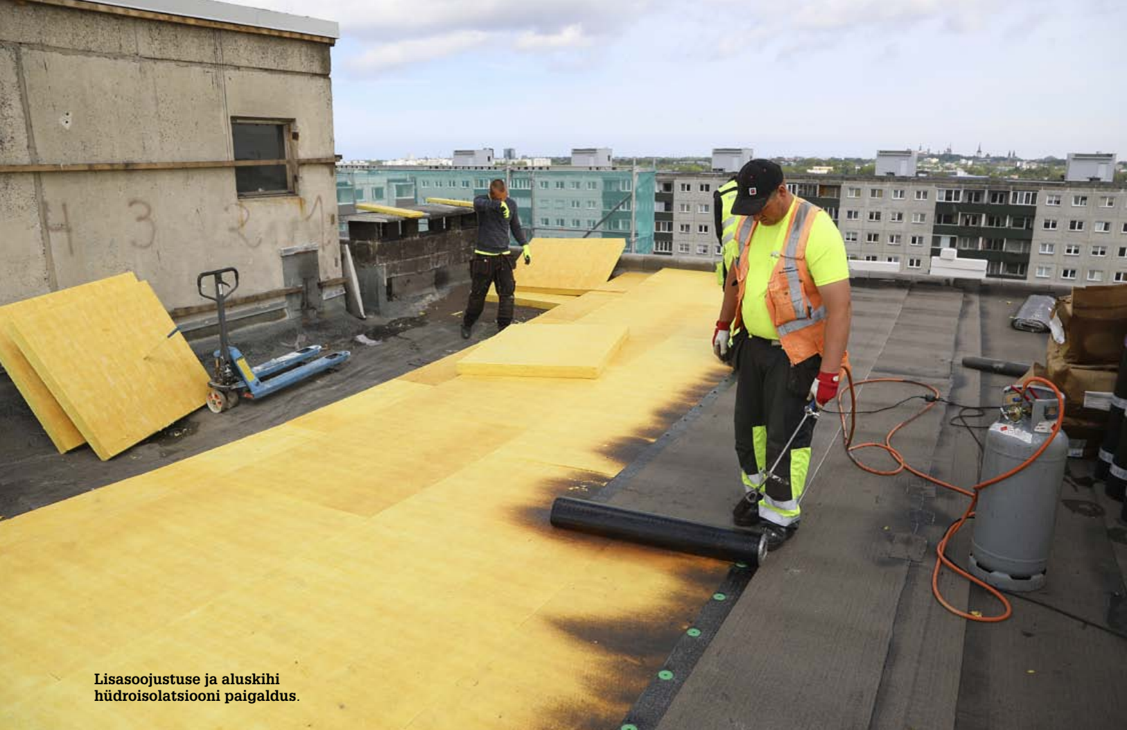
Lisasoojustuse ja aluskihi hüdroisolatsiooni paigaldus.