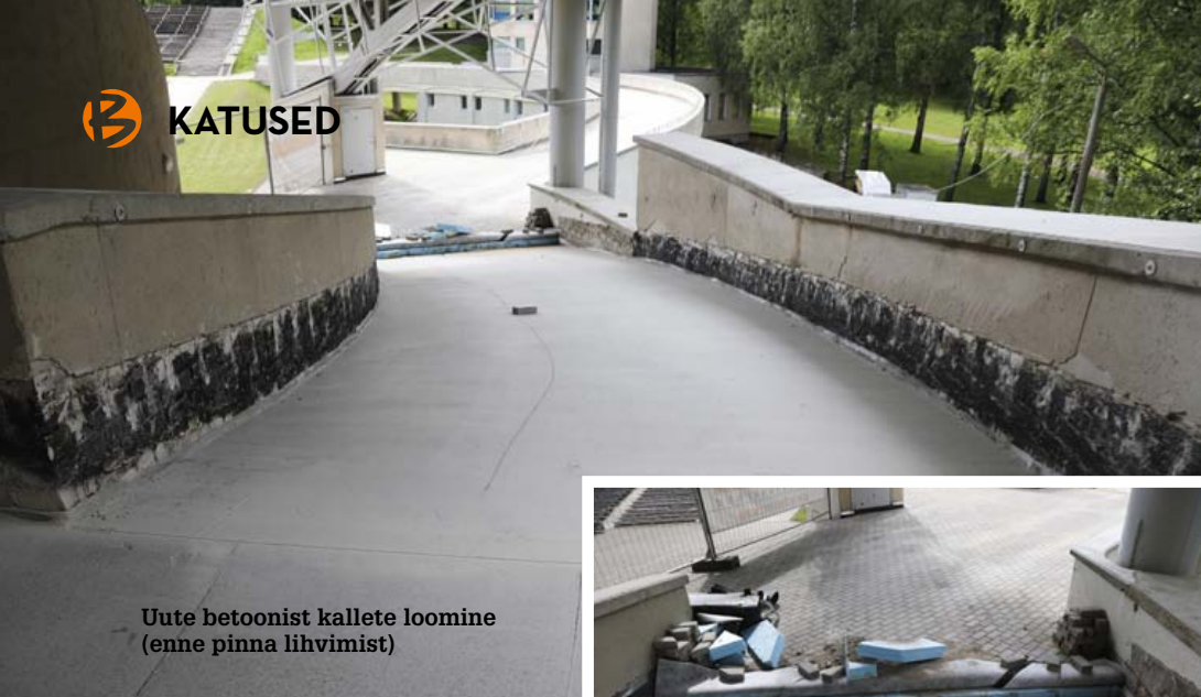
Uute betoonist kallete loomine (enne pinna lihvimist)