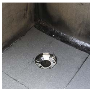
Äravoolehtri alumise astme ääriku liide pealiskihi hüdroisolatsiooniga.

Alajaama osas remonditi lagunenud silikaattelistest parapetiosa ja selle pind krohviti üle. Parapetiplaat tehti valubetonist.