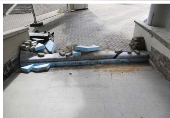
Renoveeritud ja renoveeritava osa liitekoht tööde käigus

Raadiotornis asuvad helimeeste ja valgustajate ruumid ning laod ja väikesed stuudiod ning esimesel korrusel pisike spordipood. Esi-