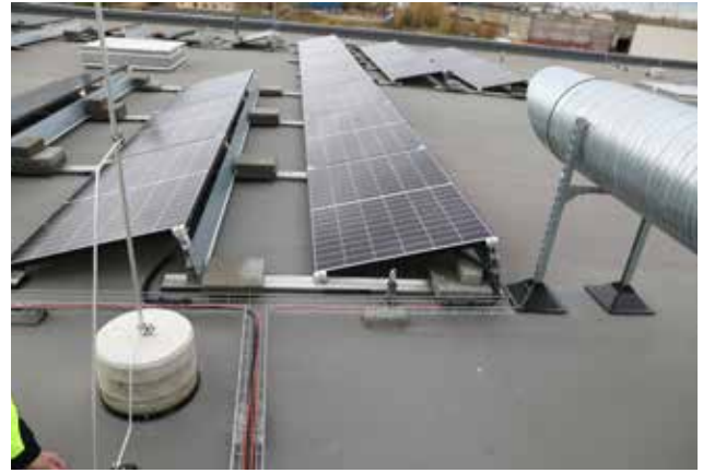
Kaablid ja juhtmed on paigaldatud vett läbilaskvatele rennidele, mis toetuvad katusele spetsiaalsetele alustele. (Eesti). Kaablirennid võiks olla pealt kaetud.

1100 mm kõrguste piirete või parapettideta ei tohiks päikesepaneelidega katuseid planeerida.