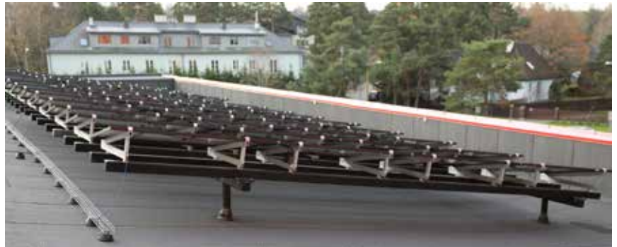
TalTech Mäemaja päikesepaneelid on paigaldatud aluskonstruktsioonidele toetuvatele pollartitele. See tekitab küll marginaalsed külmasillad, kuid võimaldab korrektset katuse hooldust. Hoonel on kõrged parapetid ja seepärast ei ole vaja ka turvaravastust.

Kui see on tehtud, tuleks tellida eriala asjatundjalt katuse audit (vajadusel koos katuse avamistega). Eriala eksperdid oskavad hinnata paneelide mõjusid katusele, olemasoleva katusekatte jääkressurssi, soojustuse ja sõlmalahenduste võimekust lisakoormuste talumiseks, samuti turvaravastuse lahendusi.