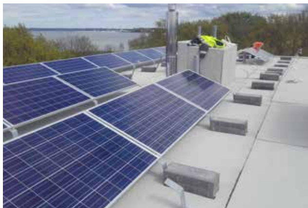
Lattrauast paneelide alus on kohati otse katusekattel. Kinnitused läbivad katusekatet. Selline paigaldusviis on katusekattele kahjulik.

Seejärel tuleb määratleda ohuallad ja koostada turvavarustuse või piirete projektlahendus, mis meil üldjuhul ära jäetakse. Ilma turvavarustuse, vähemalt